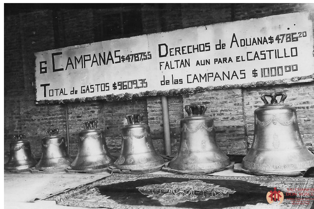
Foto: campanas compradas para la obra de Fortín Mercedes. Repositorio AR-AHS ARS / BB.

Fuente: Entraigas, R. (1961). El hornero de Dios . Ediciones Don Bosco. Buenos Aires. Pp. 220-221.