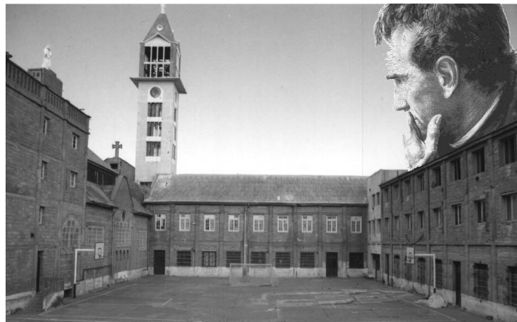
Foto: Patio del Colegio San José de Puerto Deseado. Casa Salesiana San José – Puerto Deseado – Portal oficial de la obra salesiana San José de la ciudad de Puerto Deseado

Fuente: Bruno, C. (1993): Los Salesianos y las Hijas de María Auxiliadora en la Argentina . Volumen quinto 1922-1934. Buenos Aires. Instituto Salesiano de Artes Gráficas. Pp. 246-247.