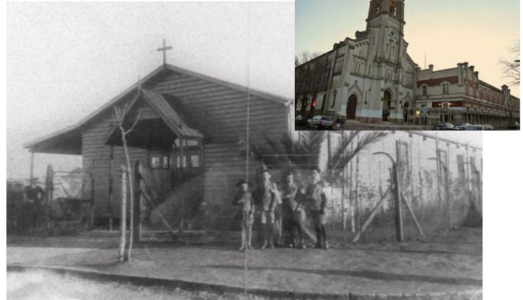
Parroquia San Pablo

Fuente: http://fotosviejasdemardelplata.blogspot.com/ . Guía de sitios salesianos