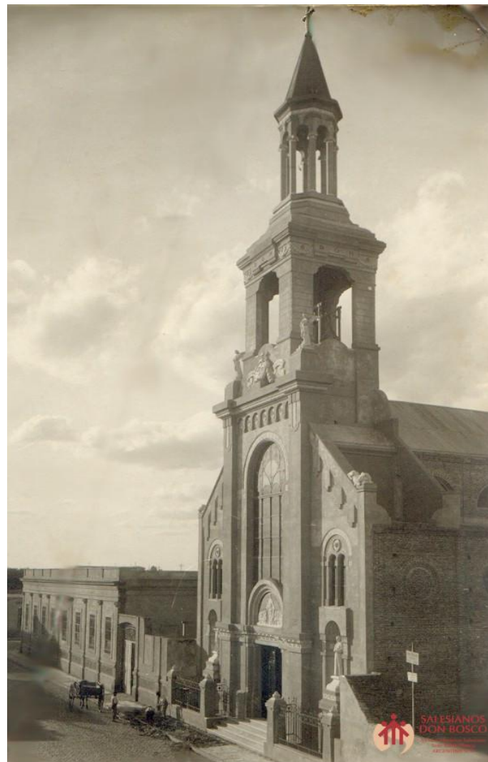
(1913) Iglesia Sagrado Corazón en construcción.