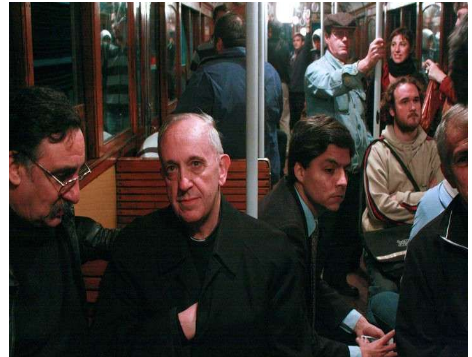
Foto: padre Bergoglio viajando en subterráneo en Buenos Aires. El viejo vagón del subte A que llegó hasta el Vaticano

Bergoglio, Jorge Mario (2007). El verdadero poder es el servicio . Buenos Aires. Editorial Claretiana.