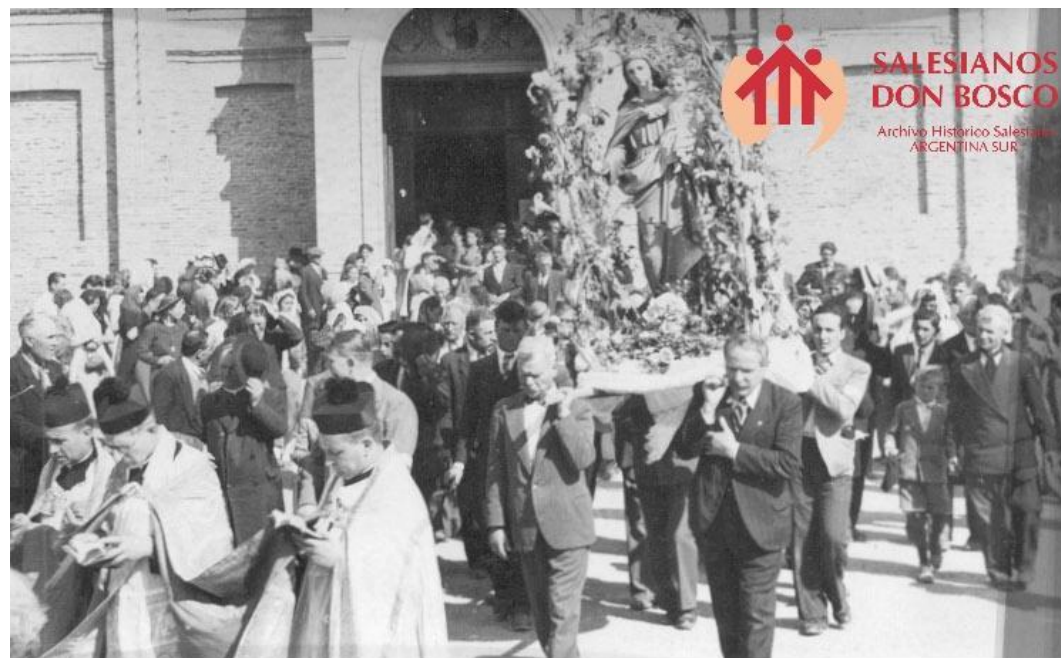
Foto: Zatti llevando a la Virgen en la procesión de María Auxiliadora en Viedma. Repositorio AR-AHS ARS / BB

Fuente: Comisión Pro-Templo (1915) "In Memoriam. P. Evasio Garrone" Flores del campo, Viedma. https://zattilapelicula.com.ar