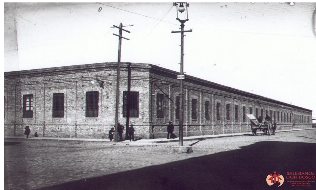
Foto: construcción del “Colegio Don Bosco” de Bahía Blanca, se ve de frente la calle Vieytes y en el lateral, la calle Rondeau.

López Pascual Juliana (2013). “El desafío de la Patagonia”. Domingo Pronsato y la proyección de Bahía Blanca sobre el territorio austral. (Bahía Blanca, 1940 - 1970). XIV Jornadas Interescuelas/Departamentos de Historia. Departamento de Historia de la Facultad de Filosofía y Letras. Universidad Nacional de Cuyo, Mendoza.