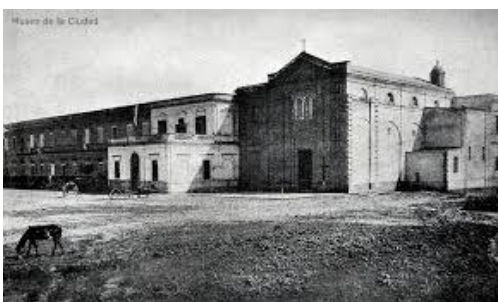
Museo de la Ciudad