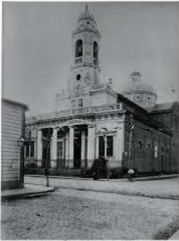
Iglesia San Juan Evangelista - 1890